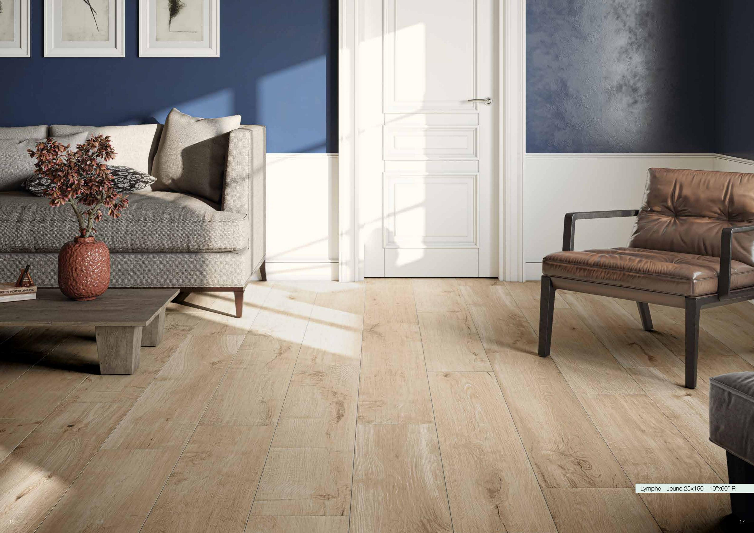
Lymphe - Jeune 25x150 - 10"x60" R