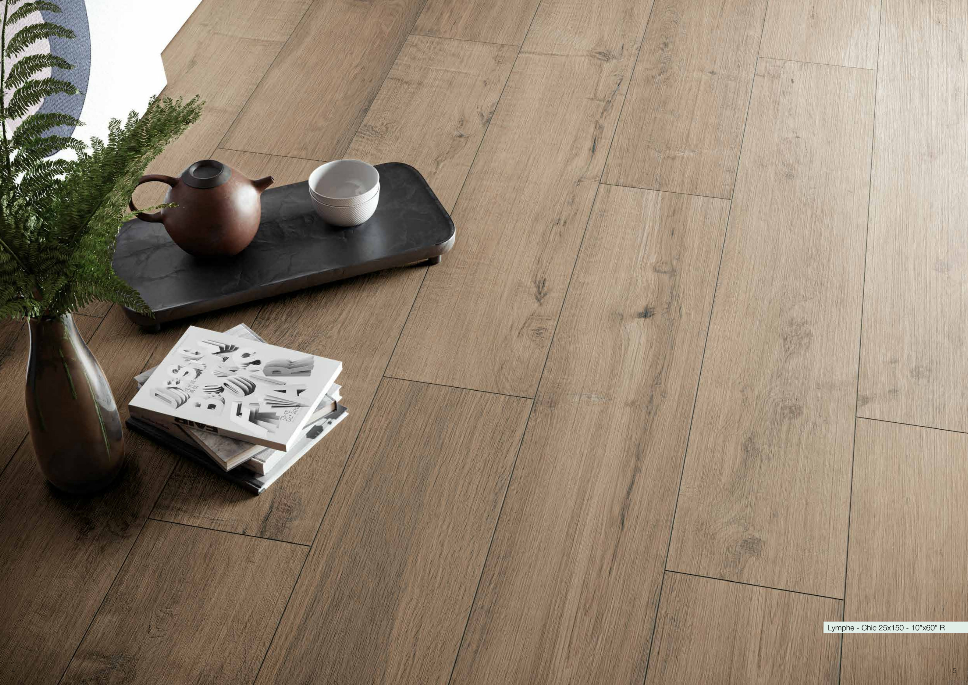
Lymphe - Chic 25x150 - 10"x60" R