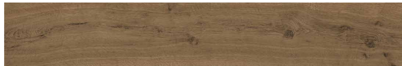
FONCÉ 25x150 - 10"x60" R