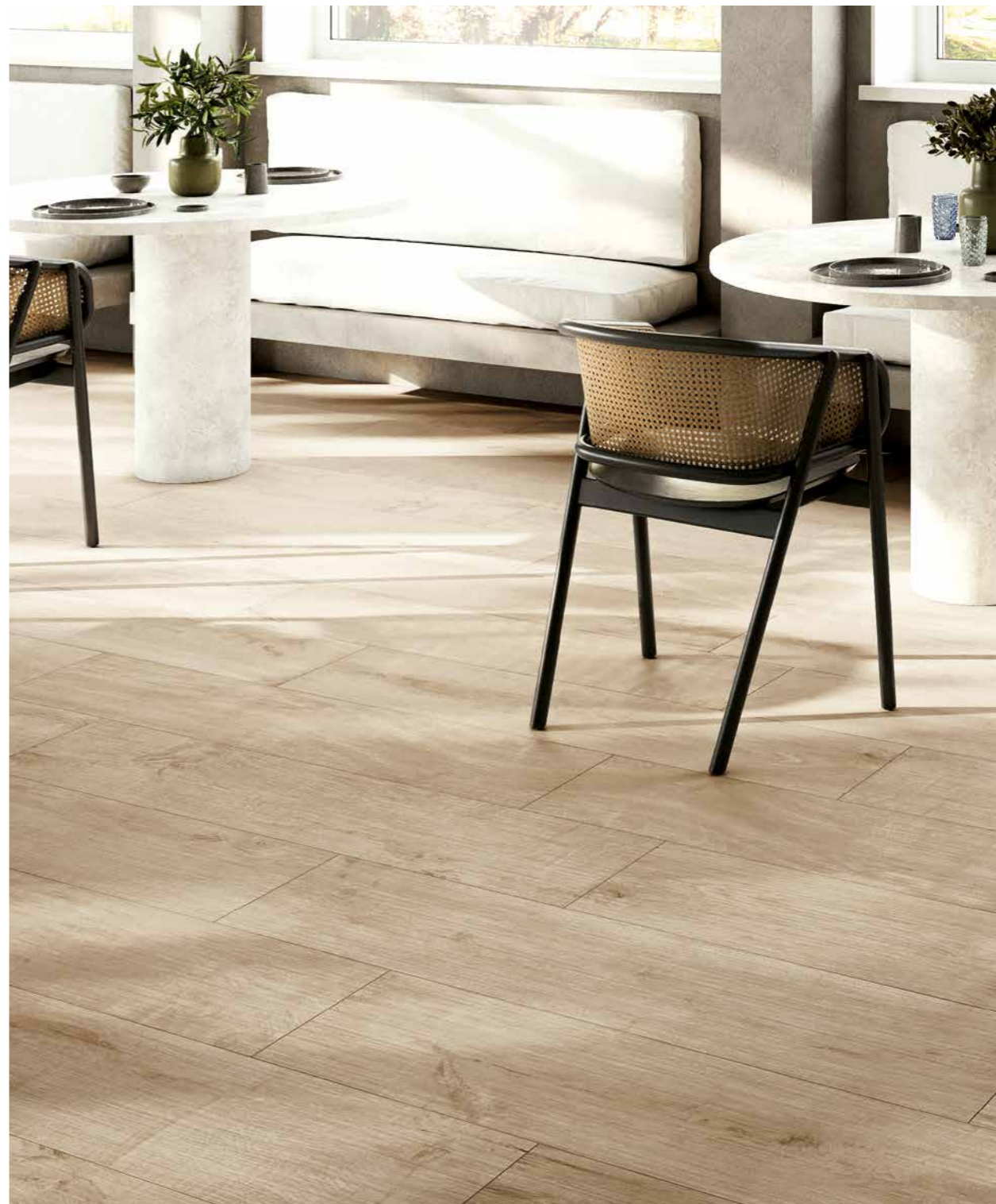
Lymphe - Jeune 25x150 - 10"x60" R