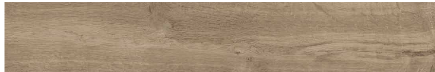
CHIC 25x150 - 10"x60" R