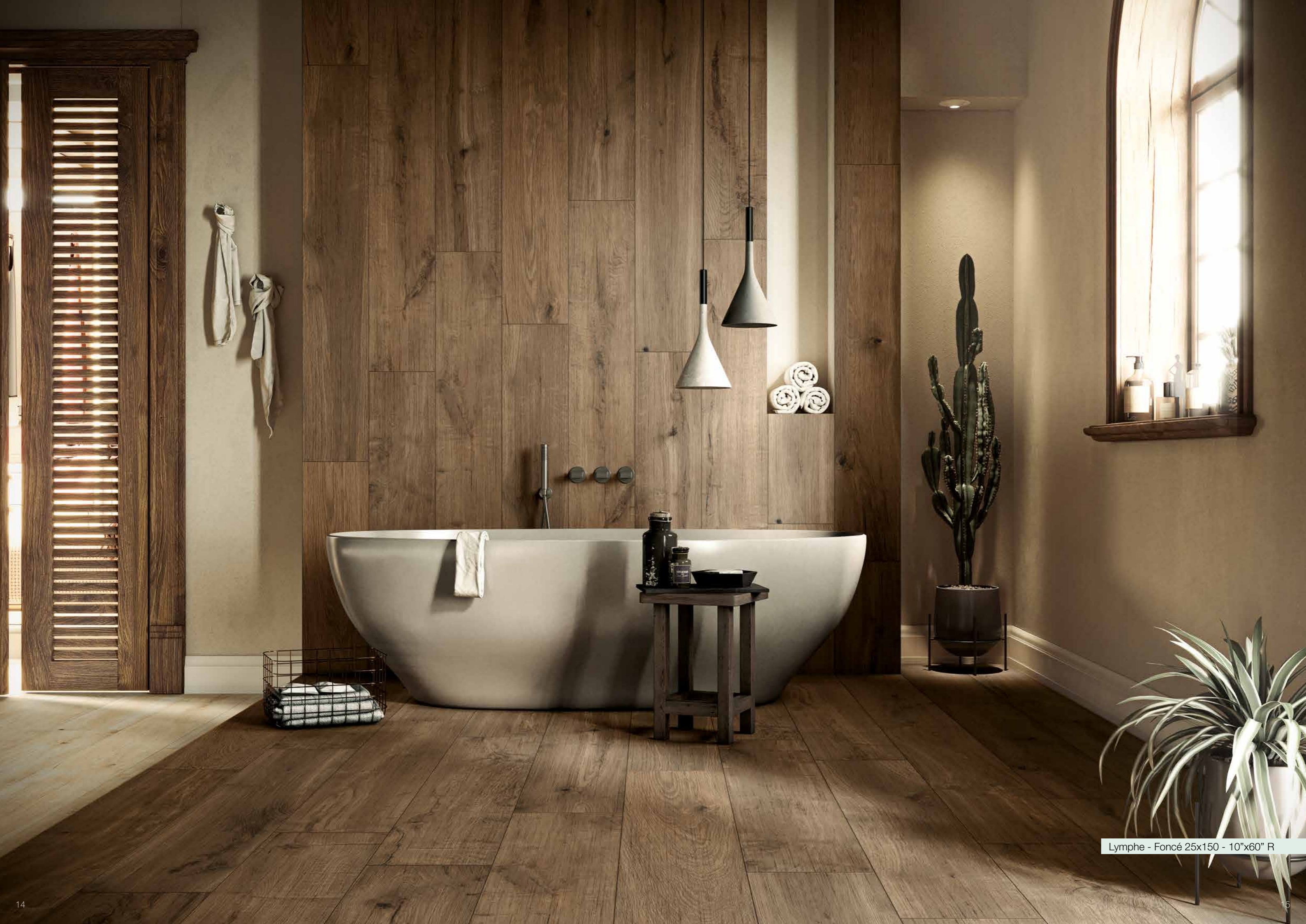
Lymphe - Foncé 25x150 - 10"x60" R