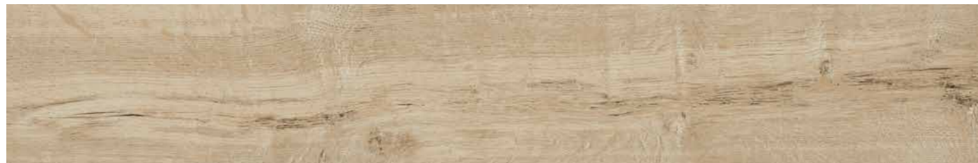
JEUNE 25x150 - 10"x60" R