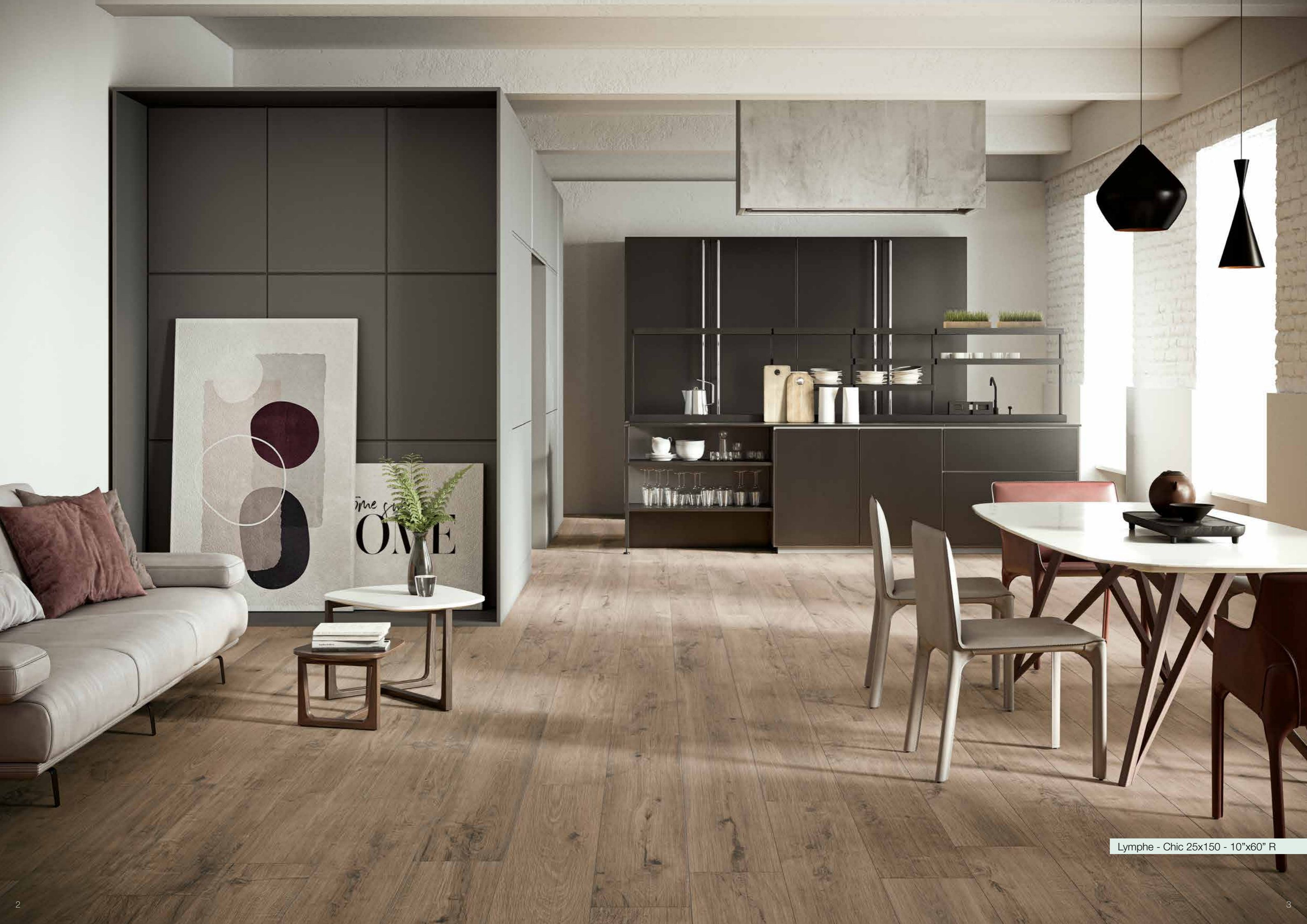
Lymphe - Chic 25x150 - 10"x60" R