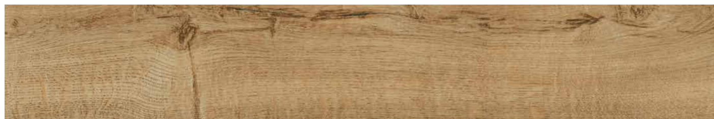
NATUREL 25x150 - 10"x60" R