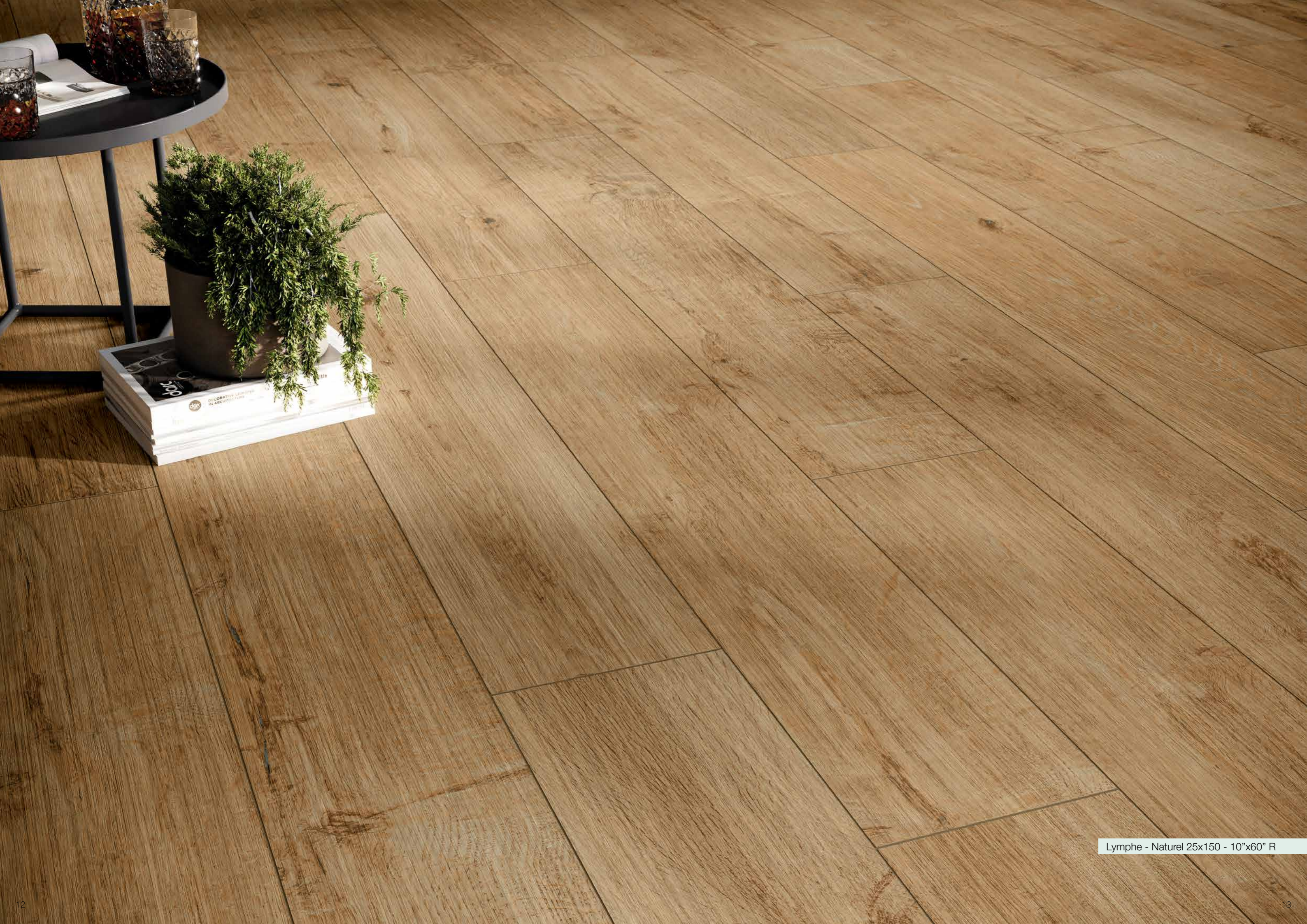
Lympe - Naturel 25x150 - 10°x60° R